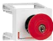
044 06 Пример установки: выключатели, индикаторы