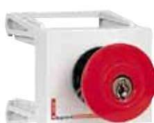
044 05 Пример установки: устройства управления